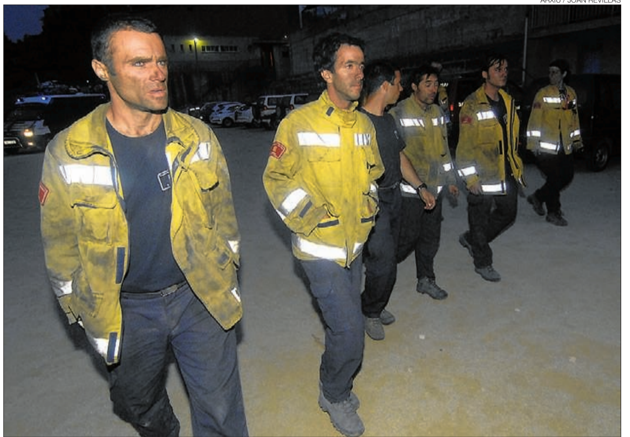
► Agents dels GRAF, abatuts després de la mort dels seus companys, el 21 de juliol passat a Horta.

FOC SOSTENIBLE // Que deixar cremar un bosc pot ser, en determinades condicions, fins i tot beneficiós és una cosa que els experts han anat defensant des de fa temps. Un foc, si està ben controlat, si es produeix en una zona boscosa ben estructurada, pot ajudar a netejar la malesa del so-