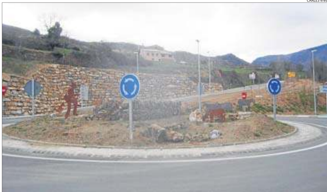
Imatge de la rotonda de Sort, on es col·loquen els agents policials, segons l'alcalde, Agustí López.

Les comarques de Lleida són les que, en general, registren els percentatges més baixos d'alcoholèmies positives de Catalunya, com mostra el mapa superior. En aquest cas, les zones de la costa sí que donen més positius que la resta del territori.