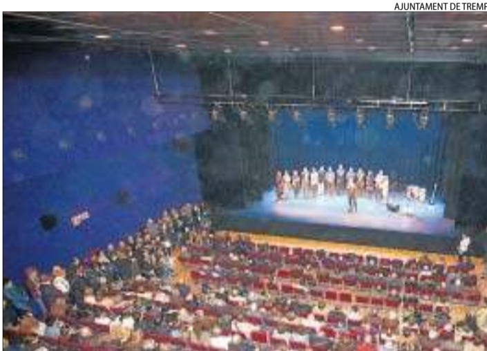
Imatge del concert inaugural de La Lira amb l'Orfeó de Tremp.

El conseller de Cultura, Ferran Mascarell, va inaugurar el 25 de novembre el nou edifici del centre cultural La Lira de Tremp, una moderna infraestructura per a cine, teatre i música que ha costat 3,9 milions d'euros i tres anys d'obres després de l'enderroc al setembre del 2008 del vell local inaugurat el 1935.