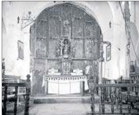
FONS SALVANY/BIBLIOTECA DE CATALUNYA

ta a la sala Alcalá de Madrid al juny del 2009. El ministeri de Cultura va licitar per ella (va pagar 9.500 euros) a petició de la Generalitat i també, de forma sorprenent, del Govern d'Aragó. Un any després, els tècnics del ministeri van decidir atorgar-la a Aragó i van donar la raó a un informe redactat, curiosament, per una assessora de la Universitat de Saragossa que al·legava que l'obra procedia d'un retaule de Barbastre. Velasco contradiu aquesta versió amb uns arguments (històrics, estilístics i fins i tot de mesures de la taula) que, tot i això, no han fet fins ara que el Calvari recuperi el seu origen, Son, i el seu autor, Pere Espallargues.