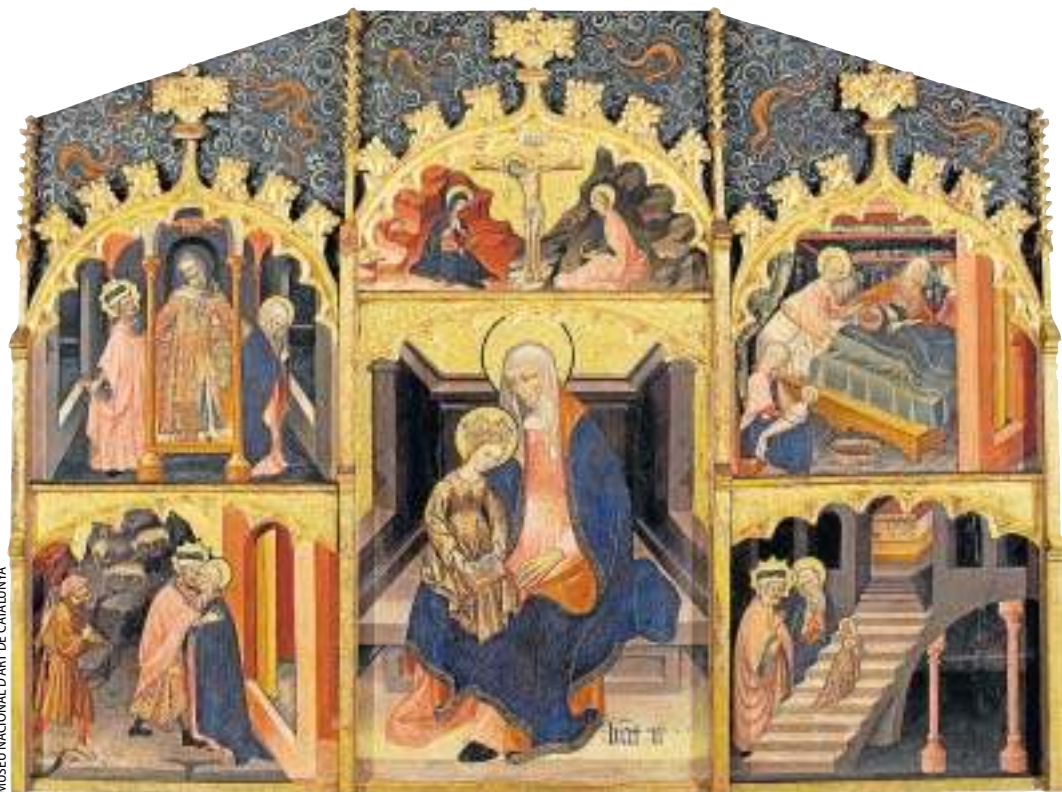
MUSEU NACIONAL D'ART DE CATALUNYA

Velasco va descobrir que un retaule del segle XV que s'exhibeix des de fa més de 60 anys a Detroit, als EUA, procedeix d'Espui, al Pallars Jussà. Va ser venut el 1925 amb el vistiplau del bisbe d'Urgell.