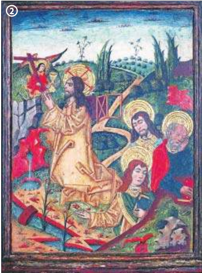
MUSEU MARICEL DE SITGES