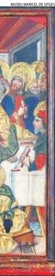
MUSEU MARICEL DE SITGES