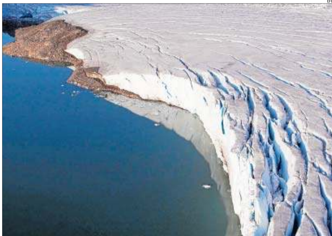
Imatge d'arxiu del desgel a l'Àrtic.