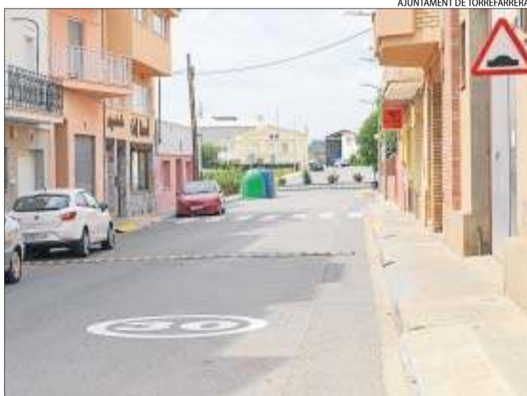
AJUNTAMENT DE TORREFARRERA

LLEIDA | La Diputació promocionarà l'oferta turística de Lleida a la fira TourNatur, del 31 d'agost al 2 de setembre a Düsseldorf.