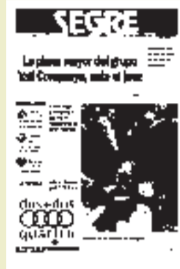
Massacre a Sarajevo.

18 D'ABRIL. La degradació del Barri Antic de Lleida es posa una vegada més de manifest amb l'esfondrament d'una casa de tres plantes al carrer Boters.