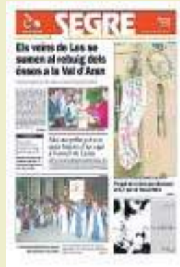
Penjat a la Seu Vella.

5 DE JULIOL. Nascuda a Barcelona però criada a Ivars, Marçal va morir als 45 anys d’un càncer. Filòloga i activista cultural i feminista, es va revelar com a poetessa el 1977 amb Cau de llunes .