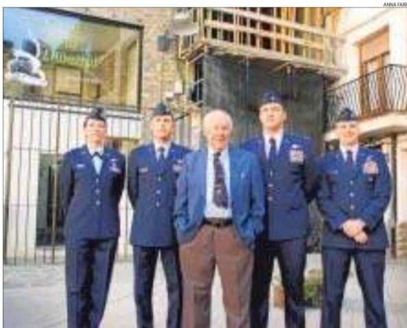
YEAGER, UN AVIADOR ESCOLLIT PER A LA GLÒRIA, A SORT