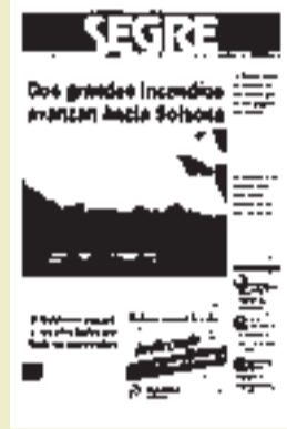
Foc a mig Lleida.

Luis Roldán, director general de la Guàrdia Civil, desapareix