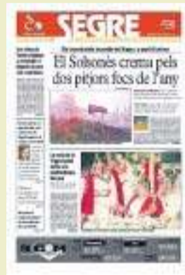
Foc al cor de Catalunya.

L’ajuntament de Lleida compra Gardeny al ministeri de Defensa