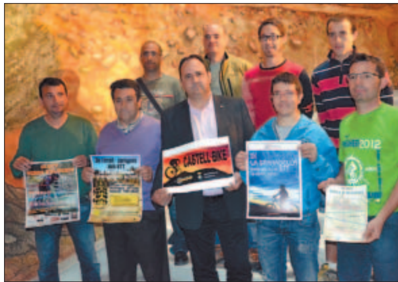
DIPUTACIÓN DE LLEIDA

Momento de la presentación que se llevó a cabo ayer en la Diputación