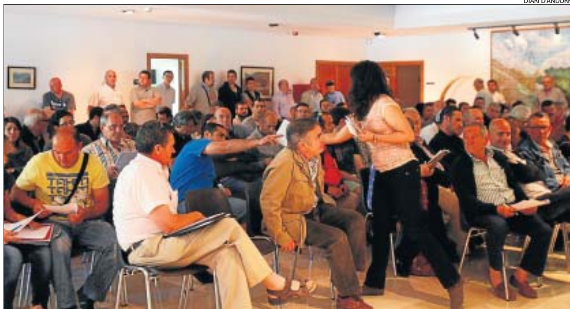
Un centenar de persones van assistir a la subhasta a la Farga de Moles.

Els articles que no es van adquirir en aquesta primera ronda es podien comprar en la segona subhasta amb els preus de sortida rebaixats. Finalment, aquells lots no adjudicats en les