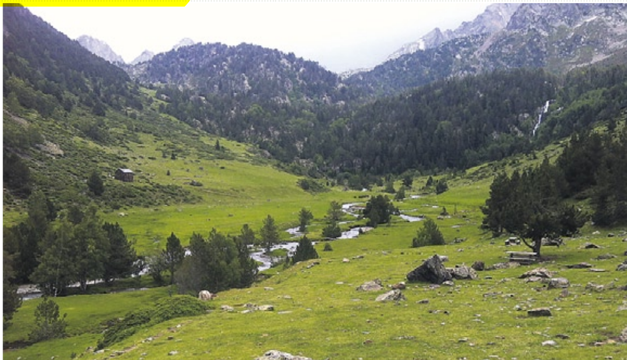
El Pla de Boet, al que se llega desde Àreu, es uno de los puntos más idílicos del Parc Natural de l'Alt Pirineu