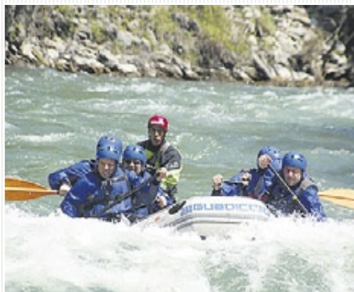
Rafting en el Noguera Pallaresa, entre Rialp y Llavorsí