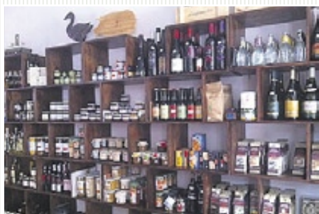
Lo Robost (Escaló) ofrece productos de la zona