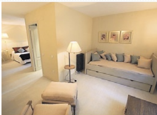
Una de las habitaciones del Hotel Poldo (La Guingueta)

oferta es larguísima y abraza todas las épocas del año. Esquí, trekking, setas, deportes de aventuras... Y es que una sola visita no basta para descubrir la belleza virgen del Pallars Sobirà. Esther Blasco