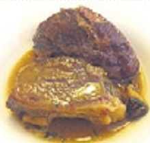
Carrilleras de vaca bruneta del Hotel Montaña (Alins)

oferta es larguísima y abraza todas las épocas del año. Esquí, trekking, setas, deportes de aventuras... Y es que una sola visita no basta para descubrir la belleza virgen del Pallars Sobirà. Esther Blasco