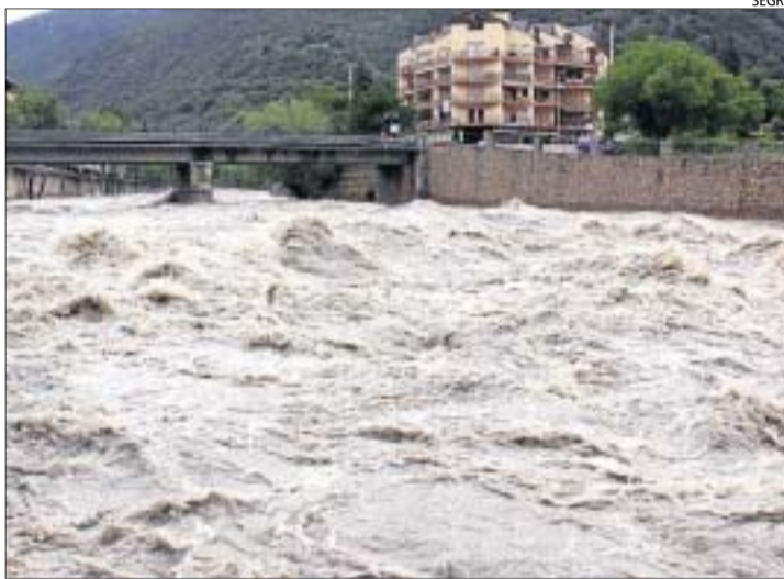
La Noguera Pallaresa, durant la riuada del juny passat a Sort.

La temporada de pesca comença a mitjans de març i s'acaba a finals de setembre. Fins a aquest any, els pescadors podien capturar truites fins a finals d'aquest mes i deixar tot el setembre per a la repoblació d'espècies, encara que durant aquell mes també es podia pescar i tornar les peces al riu. A causa dels perjudicis que han pogut causar les riuades en les espècies fluvials, la conselleria ha decidit permetre la pesca amb mort fins a finals de juliol i de-