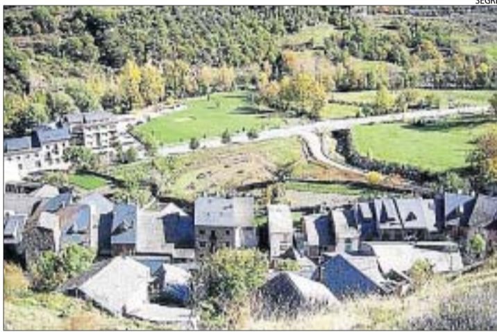
Vista d'Escaló, un dels nuclis que acollirà una piscifactoria.

El consell del Pallars Sobirà està tramitant la construcció de tres microestacions on criar alevins de truita farío autòctona del Pirineu al nucli d'Escaló, a la Guingueta; a Llavorsí, i Ainet, a Vall de Cardós, respectivament. L'ens comarcal serà l'encarregat de gestionar la construcció de les tres petites piscifactories encara que la d'Ainet serà de titularitat municipal, mentre que a les altres dos serà comarcal. Segons el president, Llàtzer Sibís, l'ajuntament de la Guingueta ja ha donat llum verda a la cessió gratuïta d'una finca de més de 600 metres quadrats a Escaló amb aquesta finalitat, mentre que a Llavorsí s'està tramitant aquesta mateixa operació. D'altra banda, el consell també tramita la concessió de cabals de la Pallaresa per part de la Confederació Hidrogràfica de l'Ebre (CHE) i la regulació d'aquests amb la companyia Endesa amb la qual té un acord que es revisa anualment de cara a l'organització d'esdeveniments esportius, com les campanyes d'esports d'aventura; dies festius, com la baixada dels Rai-