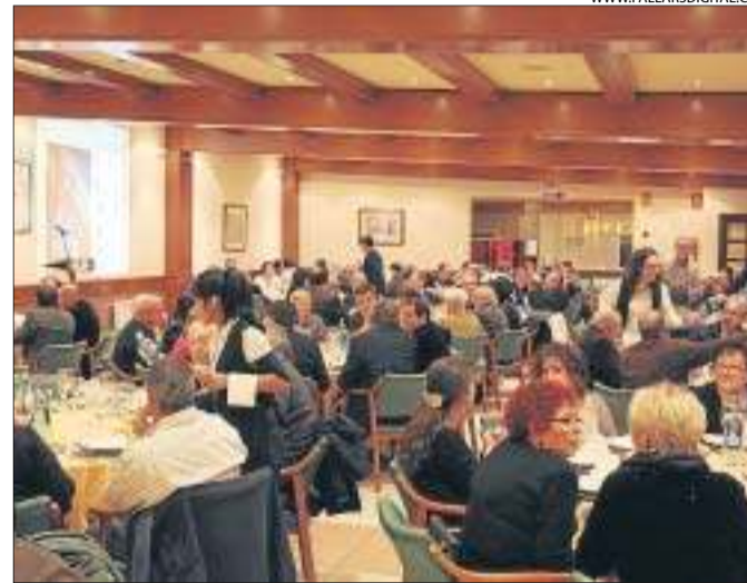
Un moment del sopar d'ahir a Tremp.